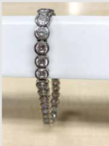
Armband Gefunden 26.10. – nach dem Oktoberfest

Fundsachen liegen in der Örtlichen Verwaltung Jößnitz zur Abholung bereit. Bitte geeigneten Eigentumsnachweis erbringen.