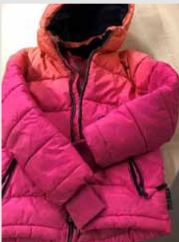
Mädchenwinterjacke Fundort Spielplatz Kurze Straße/Gemeindezentrum „Hasengrund“ – So., 17.11.